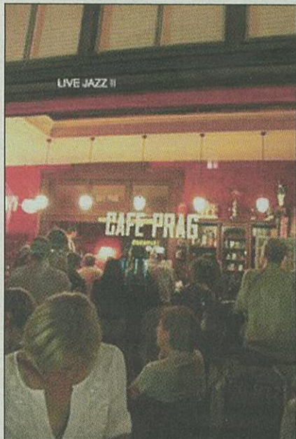
Das Café Prag, längst eine Mannheimer Institution, gibt auch 2010 wieder EJKünstlern eine Bühne. Am 10. Oktober tritt hier Stian Westerhus auf, gefolgt von Beat Kaestli am 21. Oktober und Hakon Kornstad am 8. November.

Wichtigste Spielorte sind natürlich weiterhin der Heidelberger Karlsruhbahnhof, in dem Enjoy Jazz im Jahre 1999 aus der Taufe gehoben wurde, die Alte Feuerwache in Mannheim, das Haus und das BASF-Gesellschaftshaus in Ludwigshafen.