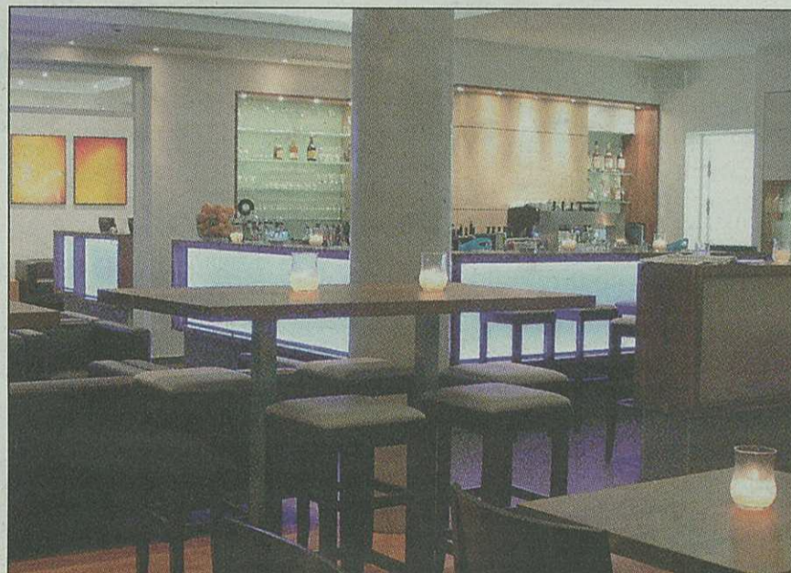
Am 24. Oktober sollen bei Enjoy Jazz nicht nur die Musikbegeisterten, sondern auch die Architektur- und Gourmet-Freunde auf ihre Kosten kommen. Das Festival und das neue Heidelberger Hotel Qube als Veranstaltungsort präsentieren einen musikkulinarischen Abend mit der Band des deutsch-türkischen Quartetts LebiDerya aus Mannheim und einem orientalischen Buffet. Hier verbinden sich sowohl musikalisch als auch gastronomisch Orient und Okzident. (s. auch Seite 7).